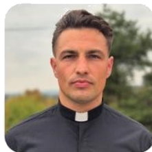
MATO ZIRDUM Župa Svih Svetih SESVETE